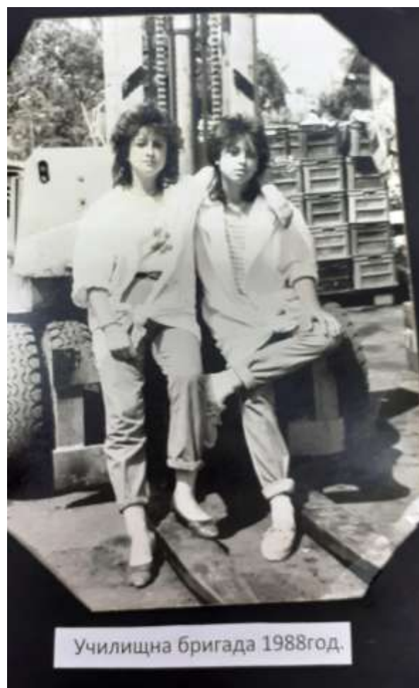
На бригада 70 -те години