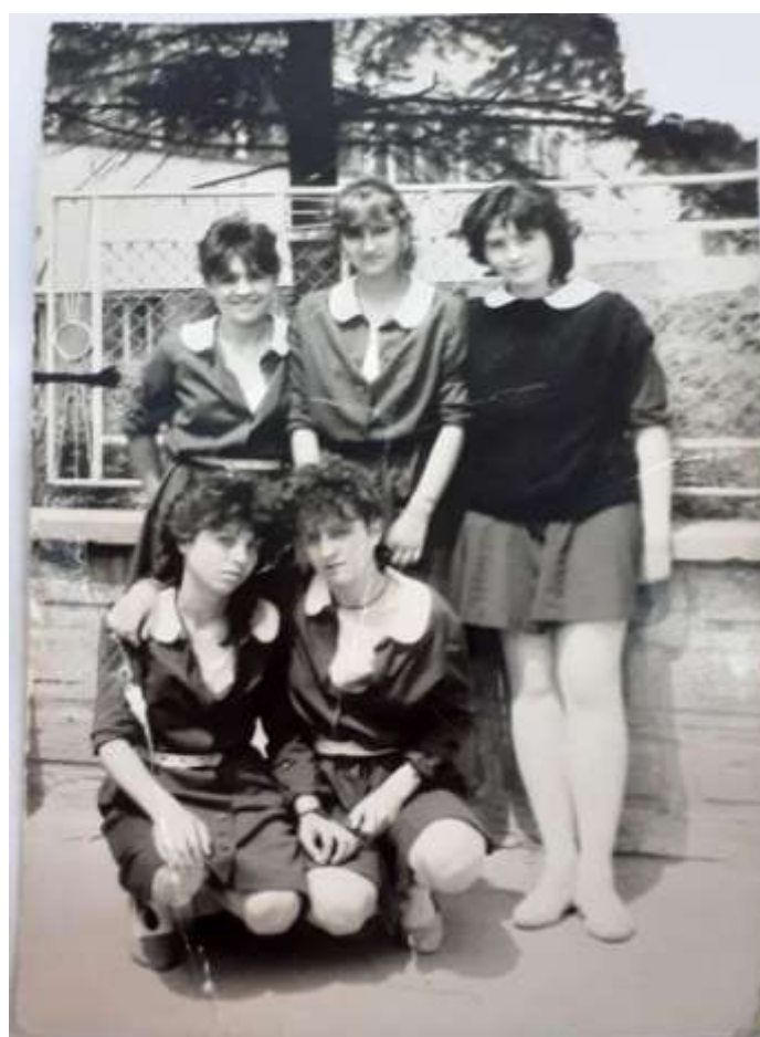
1987г.-ученички гимназиален курс