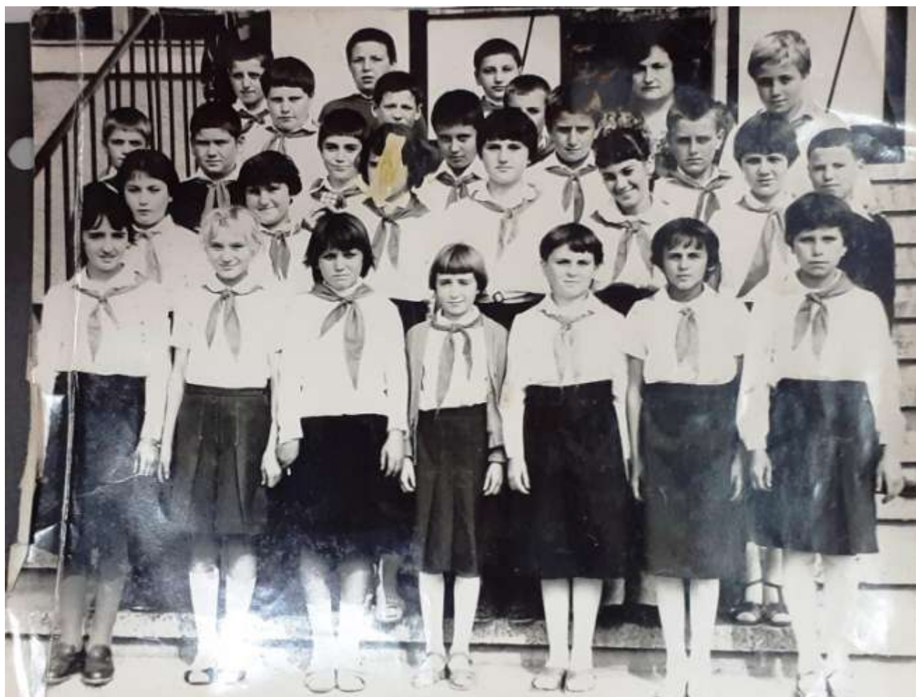
70 -те години-учители и ученици