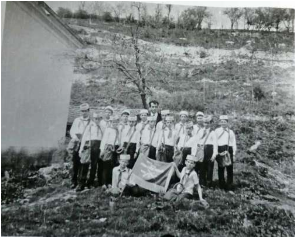
40 -те години, Празник в с. Опака