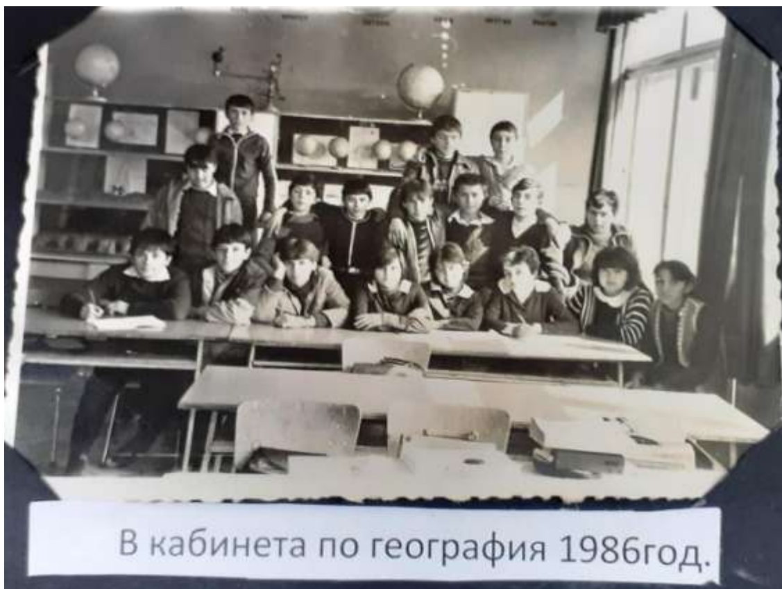
Начален курс-в час-80 -те години