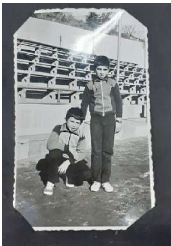
На спортната площадка 1987 год.