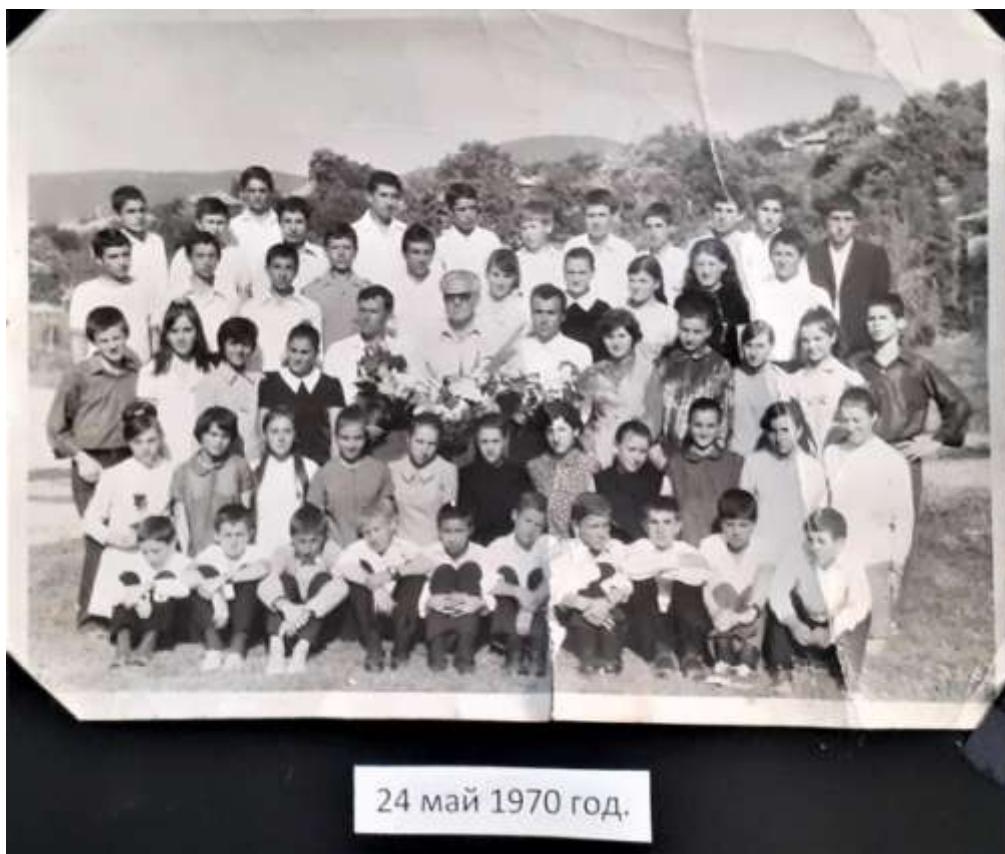
Манифестация за 24 май-70 те години