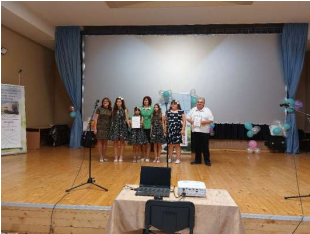
Награждаване на участниците във вокалната група

12 юни 2023г.- творческата изява по НП „Заедно в изкуствата и спорта“, която се състоя в гр. Попово в Дома на културата „Димо Коларов“. Учениците от Вокална група „Пеперудите на Опака“