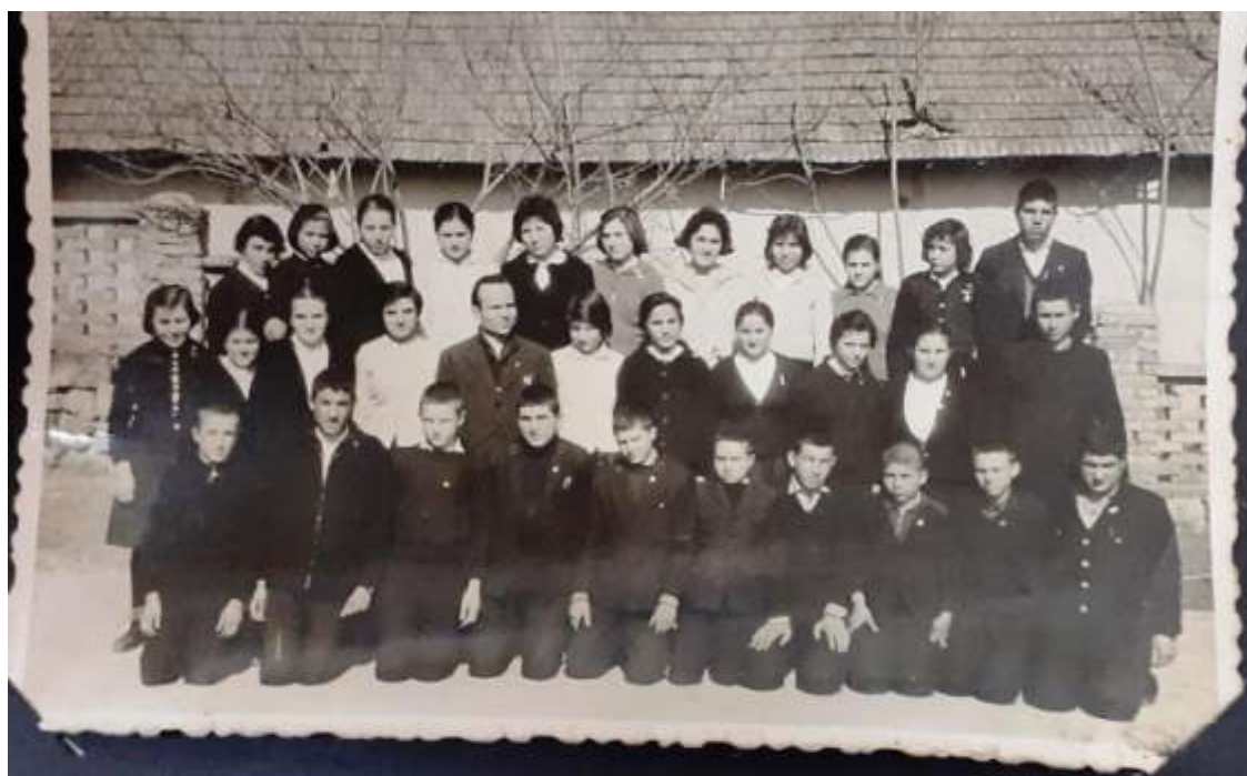
Завършване на 8ми клас 1965год.