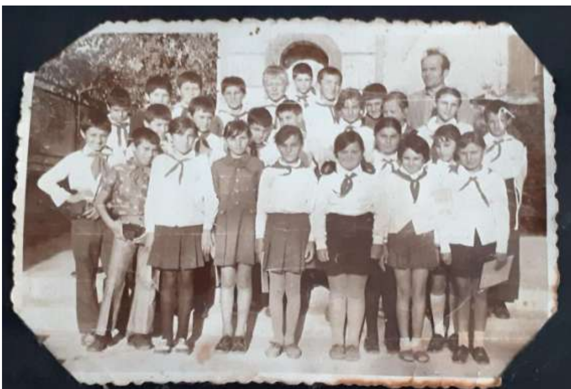
Завършване на училище 1976 год.