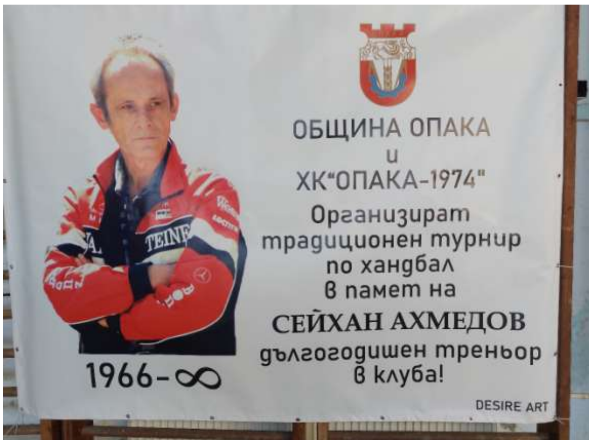
Купа Ахмедов 2016г.