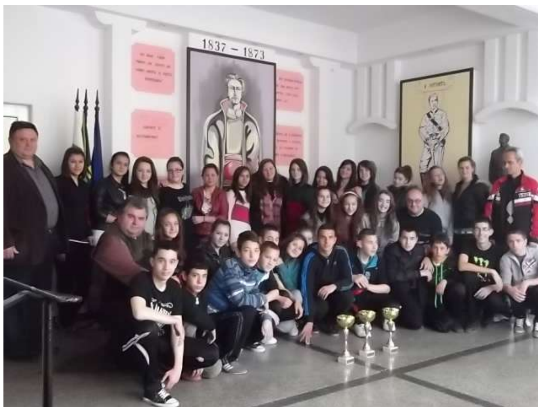
Ученически игри Бургас 2013г.- -Второ място