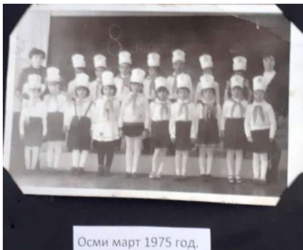
Осми март 1975 год.