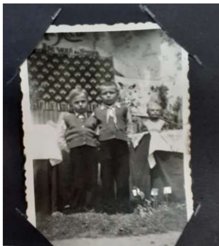
Първи май през 60те год.