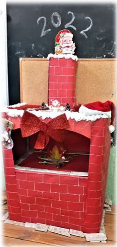
Камина - 9 клас