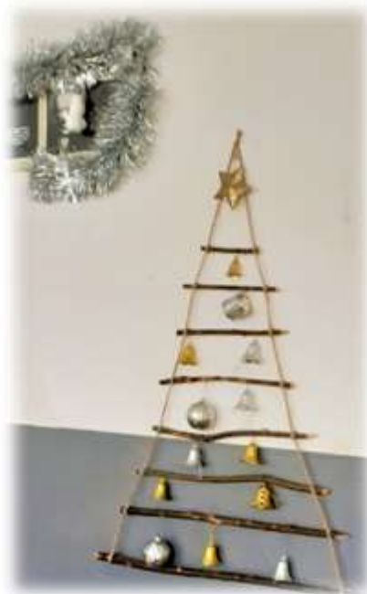
Елха – 7 клас