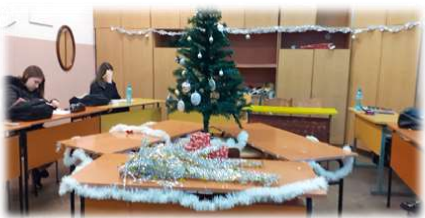
Елха – 11 клас